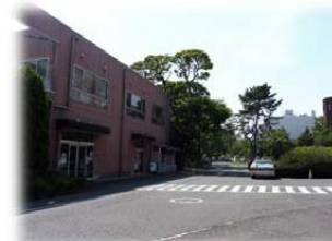
③ 左手に白金ホール (生協食堂・購買部) を見ながら前進してください。