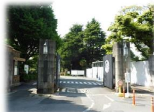
① 正門より構内へ入ります。