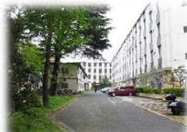
▲センター遠景(奥正面)