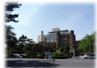
② 右手には1号館が見えます。