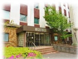
▲センター近景(入り口)

※ 現在、新型コロナウイルス感染防止対策のため、 西門は閉鎖 しております。正門では入構時に検温の上、入構届にご記入いただくこととなりますのでご協力をお願いいたします。