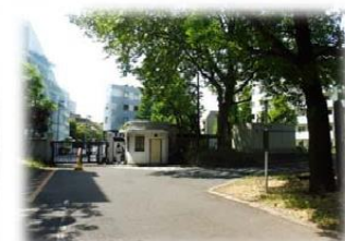
④ 奥に西門が見えます。門の手前で右にお曲がりください。